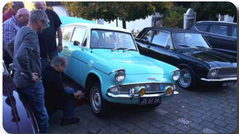
Hulp is altijd dichtbij.