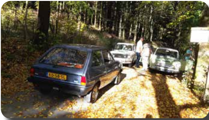
Een afgesloten weg zorgt voor wat puzzelwerk om weer op de juiste route te komen.

Na een uurtje gaan we weer verder. We komen uit op de Kahler Asten, een natuurgebied met heel veel mogelijkheden voor kilometers lange wandelingen en met prachtige uitzichten, doordat de locatie erg hoog ligt. Eén van onze clubleden had de autodeur dichtgegooid met de sleutel erin. Overall kwam hulp vandaan. De een had een draadje, de ander wist precies hoe dat het moest en in een wip was de deur weer open. Ook hier was een terras, waar we heerlijk in het zonnetje konden zitten. Het was er erg druk met andere mensen die van het heerlijke weer wilden genieten.