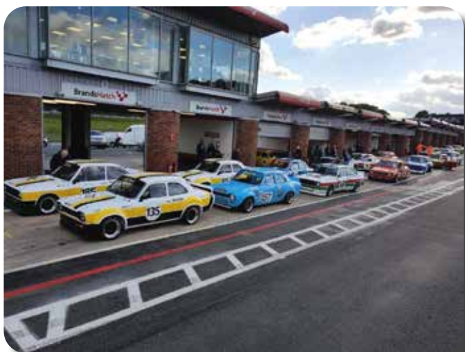
Brands Hatch Escort race.

Overigens werd de publicitair enorm belangrijke London/Mexico World Cup Rally in 1970 (4 Escorts bij de eerste 6 finishers) door Hannu Mikkola weliswaar gewonnen met een Escort MK1, maar die was uitgerust met de oerdegelijke, maar wel opgevoerde, 8 kleps, 1850 CC Kent motor. Toen in 1974 de Escort Mk2 zijn opwachting maakte bleek ook die vrijwel onverslaanbaar en de successen duurden tot 1980 toen de 4-wiel aangedreven auto's het voor het zeggen kregen.