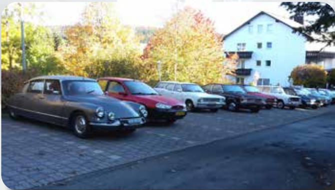
Diversiteit aan klassiekers bij het hotel.

wegverkeersproblemen en een ongeluk. Maar we hadden genoeg tijd en het laatste stukje rijden we al door een prachtig stuk Sauerland. Om 10 over half 5 komen we aan bij het hotel waar we hartelijk worden ontvangen door Jan en Anja Tinga. Er waren al wat clubleden gearriveerd. We mochten onze kamer opzoeken en die zag er heel goed uit. Daarna was er tijd voor een drankje. Om 7 uur werden de tafels keurig gedekt en serveerden Anja en Hillie een heerlijk avondeten. Als je voor 31 mensen het eten tegelijk klaar wilt hebben (wat ook lukte) vind ik dat een prestatie van formaat. Mijn complimenten daarvoor. We hebben heerlijk gegeten. Er was keuze uit lasagne, macaroni en penne.