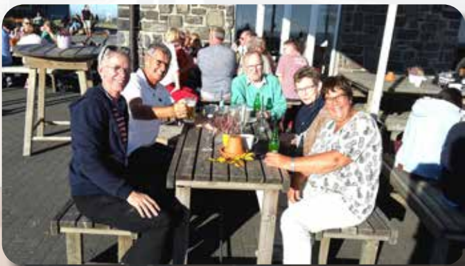
Het hele weekend echt terrasweer.

Na een uurtje gaan we weer verder. We komen uit op de Kahler Asten, een natuurgebied met heel veel mogelijkheden voor kilometers lange wandelingen en met prachtige uitzichten, doordat de locatie erg hoog ligt. Eén van onze clubleden had de autodeur dichtgegooid met de sleutel erin. Overall kwam hulp vandaan. De een had een draadje, de ander wist precies hoe dat het moest en in een wip was de deur weer open. Ook hier was een terras, waar we heerlijk in het zonnetje konden zitten. Het was er erg druk met andere mensen die van het heerlijke weer wilden genieten.