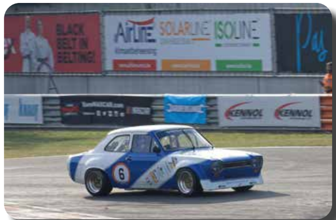
Marcel Frijlink winnaar race 1 Zolder.

En dat de Escorts nog immer succesvol zijn bleek 2 weken later toen de laatste 2 races voor het HARC GTCC kampioenschap, ver voor de Porsches ( door Frijlink steevast "platte kevers genoemd"), een mooie prooi voor de RS 1600 Escorts van Marcel Frijlink en Freddy van Sprundel werden, terwijl Freddy voor ("Woeste") Willem Oosterhagen met zijn RS2000 wederom het kampioenschap binnen hengelde. Op de circuits en in vrijwel alle landen van Europa zijn de Escort Clubs gelukkig nog héél actief en wie weet zien we ze bij een volgende verjaardag over 25 jaar nog steeds rijden met.....tja wellicht een elektrische motor???