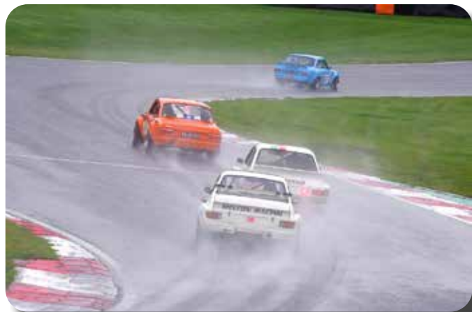
Brands Hatch Jan Willem Oosterhagen in de regen.

Helaas werd de eerste race in stromende regen verreden en werd er begrijpelijker wijs "op kousenvoeten gereden". En zoals bekend is Brands Hatch in de regen niet echt leuk. Het pitsterrein lijkt dan meer op het olympisch parcours 'wildwatervaren' en aan echte racesfeer ontbreekt het dan. Maar gelukkig werd de tweede race in min of meer droge omstandigheden verreden. De onder Britse reglementen rijdende auto's waren voor de Nederlanders veel te snel maar zij konden zich goed meten met "soortgenoten" en werden zo "best of the rest" en...zonder brokken.