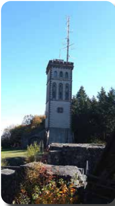
George Viktor turm.