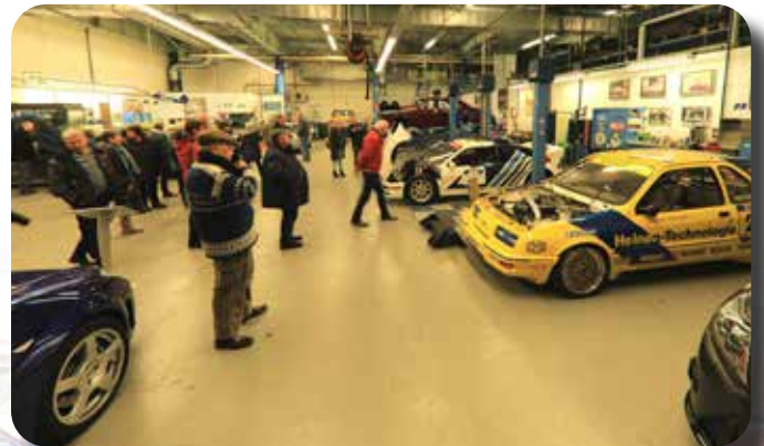
De hal waar onderhoud en restauraties worden gedaan.

Na een uurtje bereiken we de opstaptelek in Cuijk waar we de overige deelnemers in 'beschaafd opgetogen sfeer' begroeten. Het is gezellig in de bus als we in een mooi tempo de Duitse grens passeren. (Bijna iedereen heeft wel een zwager of neef in de familie waarmee je beter kunt barbecueën dan in de auto meerijden omdat er op zijn rijstijl nog wel wat is af te dingen. Maar Arie rijdt heerlijk voorspelbaar en zal dat gedurende deze twee dagen ook blijven doen waardoor het 'reizen per luxe touringcar' bijna op onze voortschrijdende to-do lijst verschijnt.) In ernst, met een door Arie en Toos