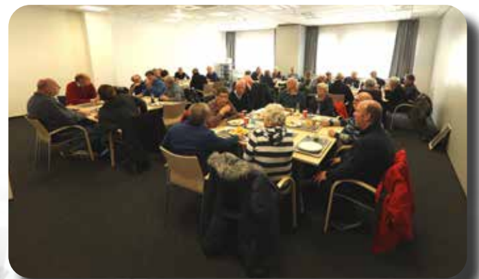
Lunch in de kantine van de Ford-fabriek.

Een beetje overdonderd door wat we zojuist gezien hebben verzamelen we ons bij de ingang van het bedrijfsrestaurant. Ondanks dat de 'fabriek stil ligt' is het er een drukte van belang. Met grote vrees zien de fabriekswerkers dat hun plekje aan hun vaste eettafel bezet gaat worden door die 'Leute aus Holland' maar gelukkig grijpt de restaurantbeheerder in en geeft hij ons een rustiger plekje in een afgescheiden ruimte. En genieten we van een eenvoudig maar voedzaam maal. Het is lunchtijd nietwaar.