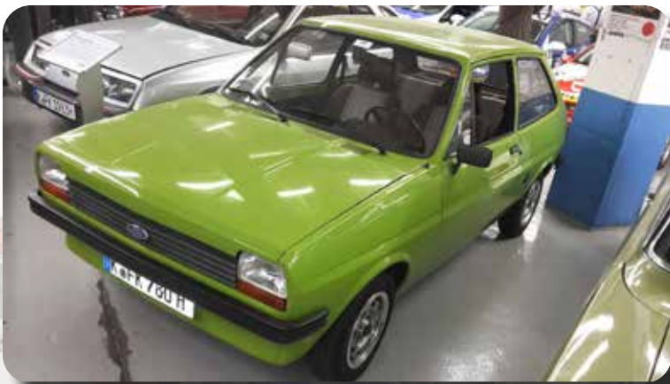
Ford Fiesta Mk 1.

Vanuit interesse was ik eerder in de gelegenheid verschillende autofabrieken te bezoeken. Toch heb ik nooit het idee dat ik erop uit gekeken zal raken. Zoals een liefhebber met plezier naar een ballet- of klassieke muziekuitvoering gaat, ook mooi en soms ontroerend, kan ik mateloos onder de indruk