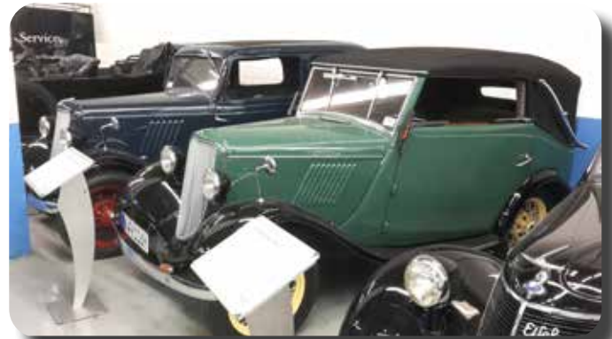
Tweemaal Ford Y.

Van tevoren was ons al duidelijk gemaakt dat het bezoek aan deze autofabriek gepaard gaat met strikte regels. Begrijpelijk, want er is best veel te zien, ook voor mensen die minder goede bedoelingen hebben. Lastig voor de enthousiastelingen in ons reisgezelschap die alles uit dit bezoek willen halen en die met telefoon of fototoestel, alles, maar dan ook alles willen vastleggen wat ze niet direct kunnen verwerken. Als