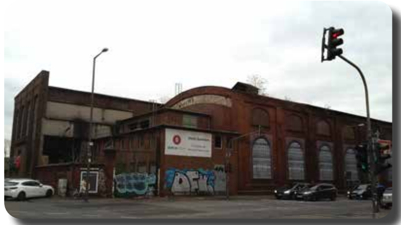
Onderweg nemen een aantal nog een kijkje bij de oude Deutz-fabriek.

In de line up van het kleine museum staat een serie van snelle en exclusieve Ford's, naast een aantal gebruiksauto's uit de jaren 1940 tot 1975. De meesten in staat van nieuw. In het kader van dit verslag gaat het te ver om al die modellen apart te benoemen maar op de website van de collectie www.fomcc.de zijn ze allemaal terug te vinden. Belangrijk is nog wel te vermelden dat de restauraties in eigen huis worden uitgevoerd en dat de gerestaureerde auto's ook terug te vinden zijn op verschillende oldtimer-evenementen in Duitsland w.o de Technico Classico in Essen. Voor ons tijd om richting ons hotel in Duisburg te gaan.