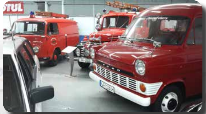
De brandweerafdeling; Ford Transit, FK en Transit.