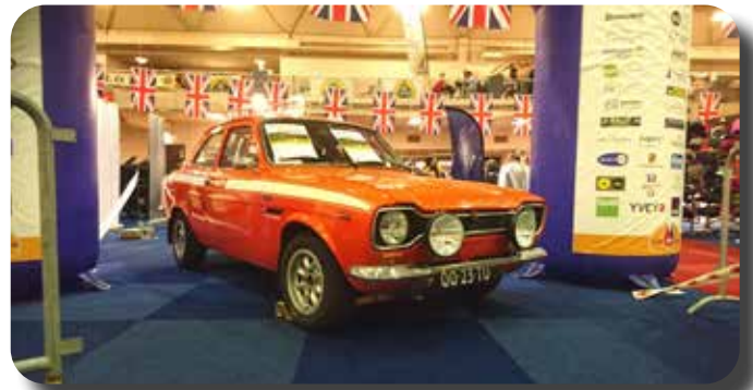
Ford Escort Mexico.

Maar omdat het dit jaar de 60e verjaardag van de Anglia 105E was en we al verschillende jaren met de gedachte rondliepen een bepaald idee uit te werken was dit jaar het meest voor de hand liggend jaar om dat speciale idee uit te werken: Harry Potter.