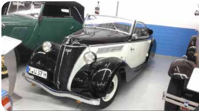
Een Ford Eifel cabriolet.

geschonken bakje koffie in de hand is het goed toeren in deze luxe reisbus van Krol-reizen uit Tiel. En zo passeren we op een kwartiertje voor de geplande aankomsttijd fabriekspoort nummer 5 van Ford Keulen. Alle tijd dus om nog even de benen te strekken en voor een sanitaire stop.