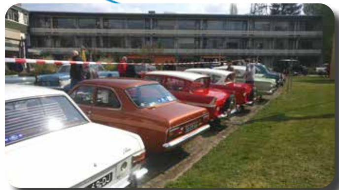
Parkeren bij de Vier Dorpen.

Met deze mensen worden soms enkele en soms juist heel veel details uitgewisseld, gedurende de volgende vervolgstappen. De onderlinge communicatie verliep in ontspannen sfeer en was daardoor bijzonder prettig. Hierdoor hebben u en alle deelnemende bewoners een leuke dag gehad!