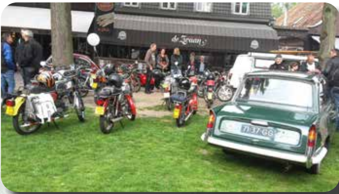
Vele brommers, maar ook leuke Engelse klassiekers waren aanwezig..

Een bont gezelschap aan oud ijzer verzamelde zich op het Vrijthof. Brommers, motoren, auto's en zelfs vrachtwagens deden mee. Tussen 10:00 en 11:00 vertrokken de deelnemers voor de toerit. Deze ging langs Oirschot, waar we nog even stopten voor een foto bij de stoel. Het normale formaat staat bij mijn ouders aan de eettafel. Bij d'n Hut was er de gelegenheid voor een pauze. We nuttigden hier met mede-EFCN-ers een kopje soep of 2 kroketten met brood. Carl en ik besloten na het pauzepunt voor de lange route te gaan. Een goede keuze, want de voorgestelde route ging langs schitterende wegen en mooie natuur. Mooi op tijd meldden we ons weer op het Vrijthof. Na nog gezellig nagepraat te hebben konden we voldaan en tevreden de terugreis aanvangen. Om half zeven stond de pick-up weer in de stalling en konden we terugkijken op een zeer geslaagde dag.