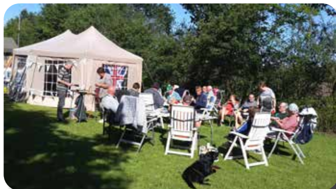
Mooi weer maakt het mogelijk lekker buiten te zitten.

vinden voor de nodige prijzen, maar dat lukt maandag wonderwel.