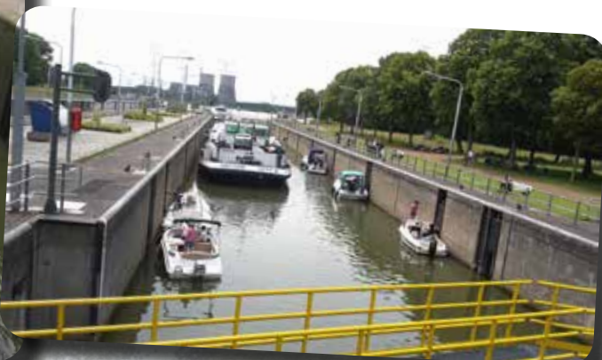
Het water is inmiddels flink gestegen.