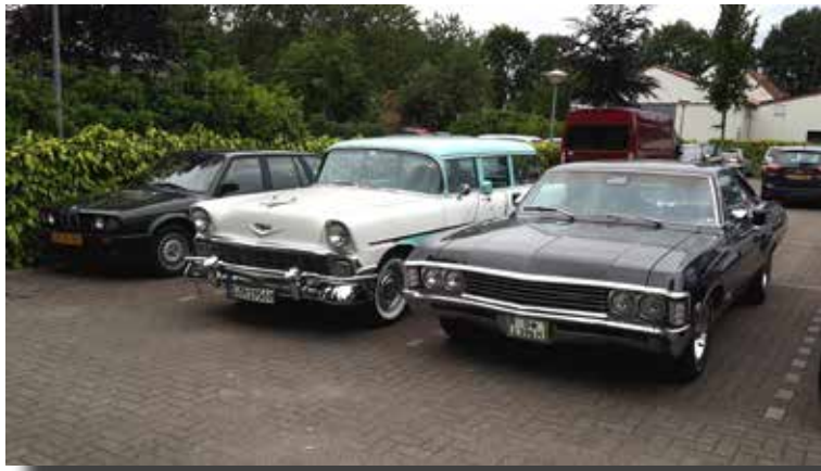
We waren niet de enige autoclub op de camping.