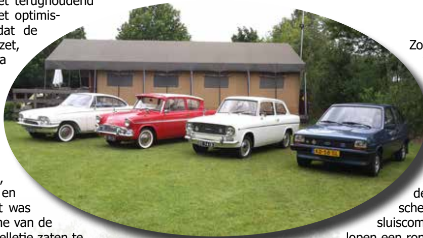
Diversiteit aan Engelse Fords tijdens het Pinksterweekend.

Op landgoed Lemmenhof treffen we al de nodige clubleden, die ook al niet terughoudend waren om te komen. Het optimisme is zelfs zo groot dat de grote tent wordt opgezet, wel stevig met extra spanbanden vastgezet en er wordt een extra gewicht aangehangen in de vorm van een gasfles. Uiteindelijk valt het allemaal erg mee. Jawel, het waait wat harder dan normaal, de grote tent stond af en toe te schudden, en dat was niet van het enthousiasme van de clubleden die een racespetletje zaten te