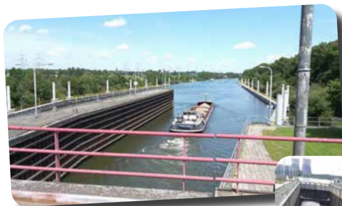
Sluizencomplex de Linne.