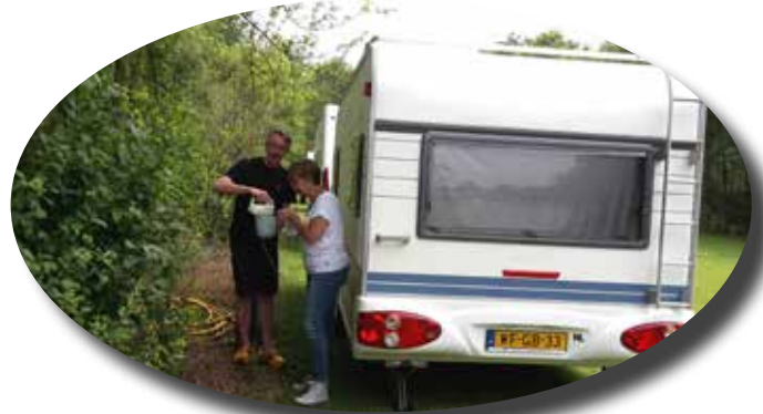
Wat gebeurt hier voor stiekems?