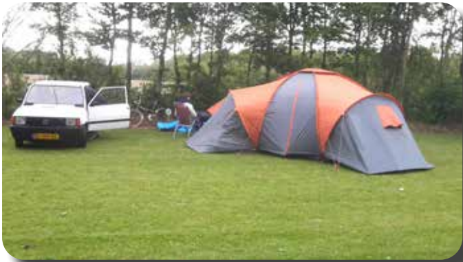
De familie Hommes heeft de tent inmiddels opgezet.

Weer is een factor van betekenis tijdens het Pinksterweekend van 2019. Vrijdagmiddag wordt al code geel gegeven in verband met harde wind en slecht weer. Toch weerhoudt ons dat er niet van om vrijdagochtend de spullen te pakken en richting Ell te rijden.