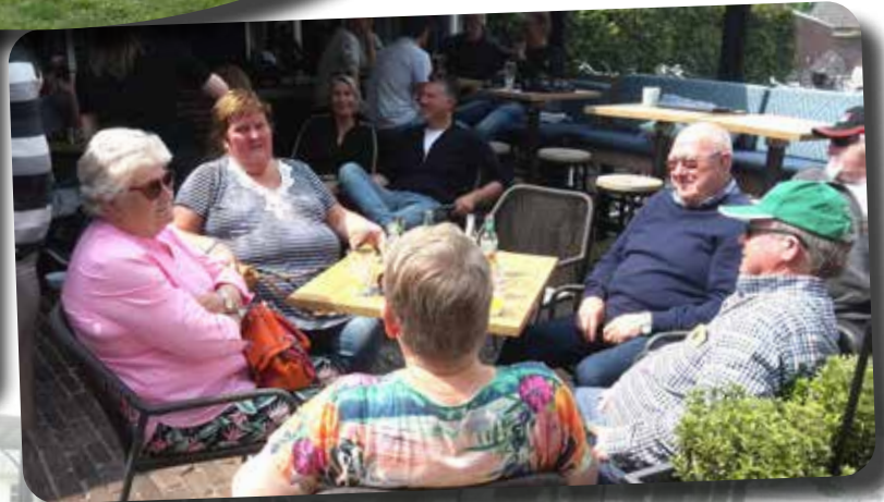
Mooi terrasweer tijdens de Oud Ijzerrit.