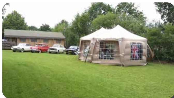
De gezamenlijke tent.

spelen, en niet iedereen sliep even goed die nacht. Nee, het weer was enigszins onstuimig, maar de volgende ochtend stond alles nog gewoon en gingen we over op de zaken van alle dag. Het wordt zaterdag zelfs mooi weer en we besluiten de rommelmarkt in Maaseik te bezoeken. De laatbloeiers hebben nog een regenbuitje gehad in Maaseik, maar toen waren wij alweer weg. Met bijna de hele groep eten we 's avonds iets in De Prairie, een prima restaurant om de hoek bij de camping.