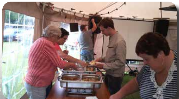
Verschillende soorten vlees, groenten en aardappelen.