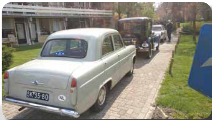
De Ford Prefect 100E van Rob en Els Bakker.

We melden de route daarna aan de verkeersregelaars, die op hun beurt de route kritisch nalopen op de haalbaarheid. Het mag best hier gezegd worden; het is beslist een hele klus om met (hoge) snelheid op de motoren langs alle oldtimers te rijden en steeds keer op keer op tijd bij de bewuste kruising goed en wel opgesteld te staan!