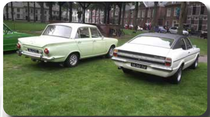
Duitse en Engelse Fords gebroederlijk naast elkaar.