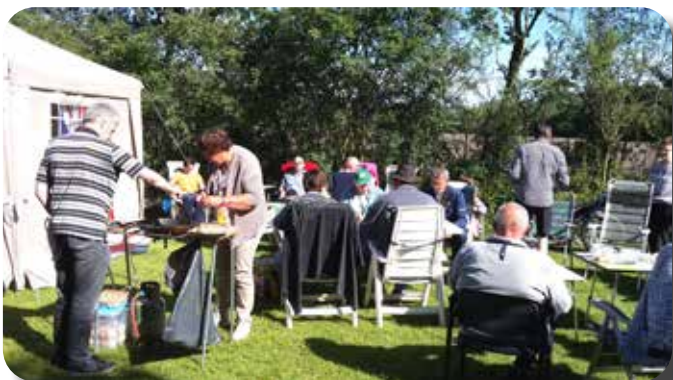
Engels ontbijt in de ochtend.

een ringmuurburcht, bezoeken de Raspberry Maxx, een biologische frambozenkwekerij en laten het knuppelbruggetjespad schieten in verband met de tijd.