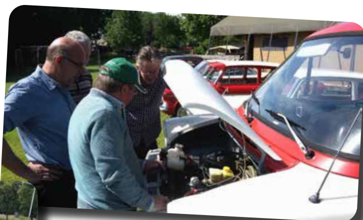
“Fraaie V6 en mooi ingebouwd hoor!”