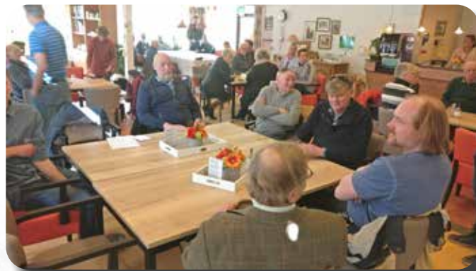
Bij de Vier Dorpen is het altijd gezellig praten en koffie drinken.

opnieuw een speciaal verkeersexamen, waarmee ze de DO-rit officieel mogen begeleiden. Ze hebben de bevoegdheid om het verkeer ter plaatse te regelen. Deze situatie maakt de DO-rit zo uniek, waarbij we als groep in lange colonne kunnen doorrijden en alle kruisingen ongeacht voorrangstelling of verkeerslichten kunnen passeren.