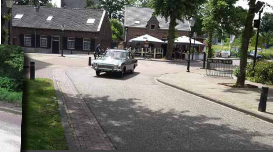
De Corsair komt de hoek om.

De maandag begint ook met mooi weer. In de loop van de ochtend worden de spullen ingepakt en de grote tent opge-ruimd. In de loop van de dag vertrekt ieder- een weer huiswaarts. Zo ook wij.