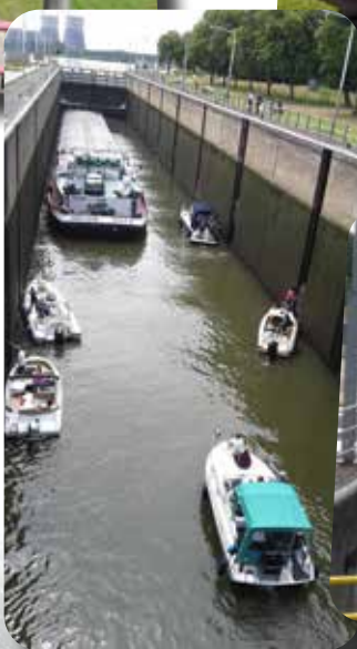
De beroepsvaart en de pleziervaart moeten gezamenlijk door de sluis.