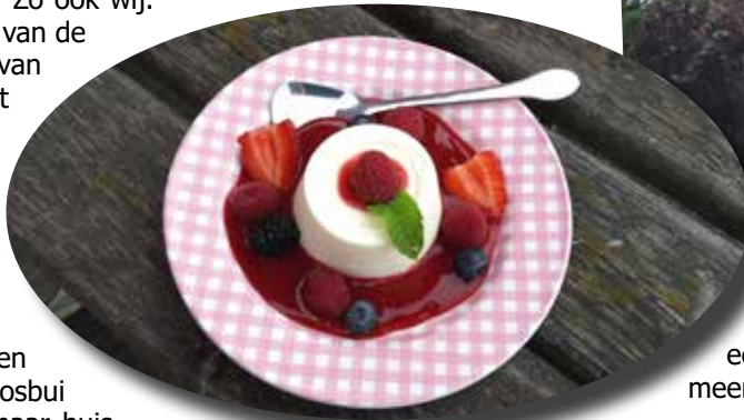
Panna Cotta toetje bij de Raspberry Maxx.

Op enkele kilometers van de stalling waar de caravan weer in moet breekt het noodweer los. We houden het niet droog. De deur van de stalling is geluk- kig al wel van het slot, maar nadat de deur geopend is ben ik al zeiknat. Na een halfuurtje is de hoosbui over en kunnen we naar huis, maar daar aangekomen zitten we weer in diezelfde stortregen en blijven we nog maar een halfuurtje in de auto zitten voordat we gaan uitladen.