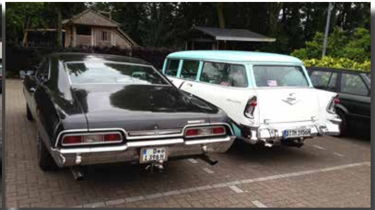
Ook enkele Duitsers met fraaie Amerikanen verbleven op de campng.