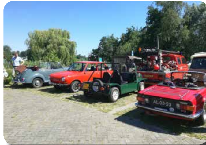
Er was een heel gevarieerd aanbod aan klassiekers.