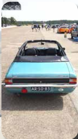
Ford Cortina Crayford.