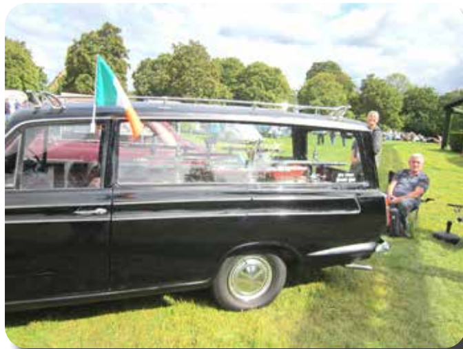
"FORD CORTINA helemaal het einde!"

Tot slot een bijzonder Cortina Mk1 stationcar gezien op Beaulieu en ingestuurd door Loek Rijssenbrij, compleet met onderschrift.