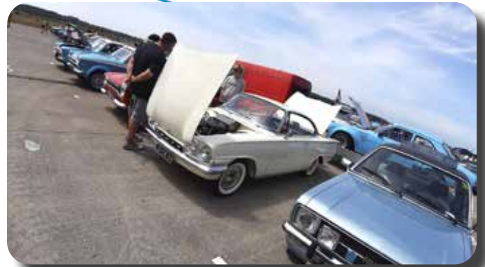
Blikvanger is de Consul Capri.

Vanwege de drukte krijgen we geen eigen laantje, we moeten het rooien met de mensen van de Mustangclub. De tien Engelse Ford vallen op die manier niet direct op binnen het