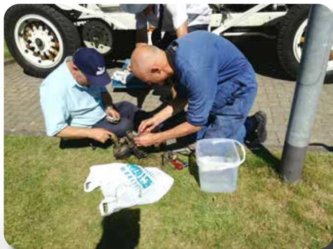
Noodreparatie aan de American La France.

Het was ongeveer 30 graden op die fraaie dag in juni, maar dankzij de ARKO (Alle Ramen Kunnen Open) in onze Ford Prefect was het prima te doen. Weinig of geen deelnemers hadden afgezegd, ondanks het warme weer. Deze rit wordt ieder jaar georganiseerd door het Nationaal Autominiatuur Museum "Het Minidome" in Asperen.