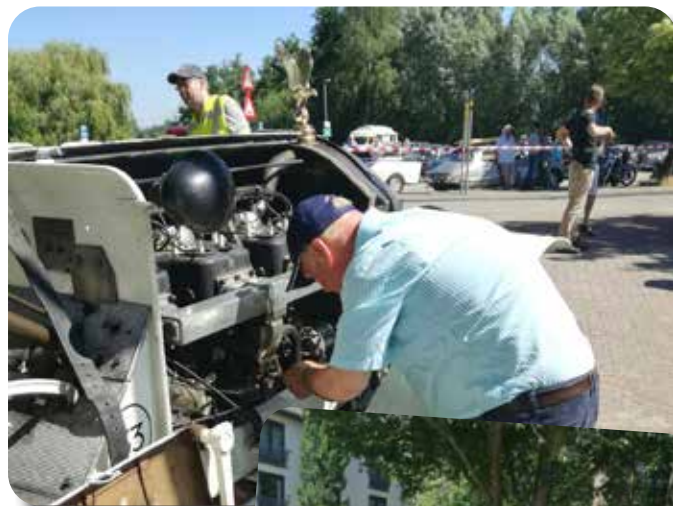
Solderen van de vlotter.

Verder reden mee onder andere: een prachtige Bedford camper, Citroen Traction, Ielijke eënd, MG's, Mercedes, oude VW en.....één Engelse Ford en dat waren wij.