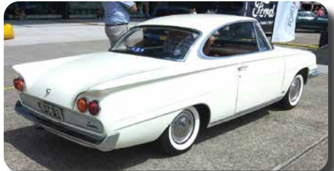
De fraaie lijnen van de Capri.

Als de meeste deelnemers zich opmaken om weer naar huis te gaan maak ik nog even gebruik van mijn Museumkaart en loop in mijn eentje het Militair Museum binnen. Het is er opmerkelijk rustig en vanuit de uitkijktoren overzie ik nog een keer de omgeving waarin ik woon. Ik kan zelfs bijna de Piramide van Austerlitz zien. En het kerkje van Leusden. Het militaire domein op de Leuserheide en de rudimenten van de startbaan. Op het platform rusten de vliegtuigen.