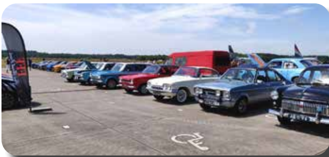
Rijte Engelse Fords van de EFCN.

30 juni 2019. Een warme, warme zondag. Als de temperatuur nog enigszins te dragen is melden zich de eerste deelnemers. Maar het kost best enige tijd voordat de eerste deelnemers op het platform van de voormalige vliegbasis Soesterberg hun positie kunnen innemen. Vraag me niet wat de oorzaak is, maar de toegangsceremonie kost ook dit keer meer tijd dan verwacht. En er zijn elk jaar meer deelnemers zoals de organisator van de Ford Familie Dag mij vertelde.