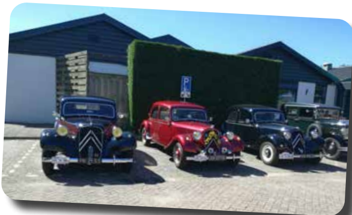
Driemaal Citroen Traction Avant.

Het is altijd een leuke rit, met veel deelnemers en mooie auto's. Volgend jaar, de laatste zaterdag van de maand juni. Misschien zijn we dan niet meer de enige Ford???