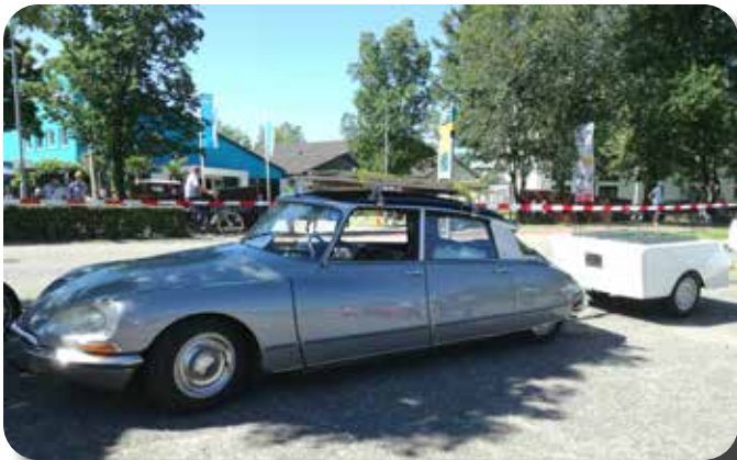
Citroen DS met leuke aanhanger.

Al snel was het gepiept en konden we de rit afmaken. Aan het einde van de rit mocht iedereen een kijkje nemen in het museum waar meer dan 7000 miniatuurauto's zijn uitgestald.