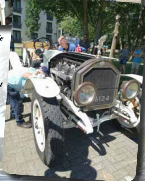
Uiteindelijk komt alles goed.