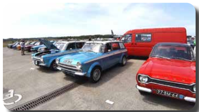
Twemaal Cortina Mk1 Estate en een Ford Escort.

enorme aantal oude en nieuwere auto's dat hier in de rijen wordt opgesteld. Maar ze zijn er wel en verschillende leden hebben dan ook snel een gezellige kring gevormd waarin ze hun eigen feestje kunnen vieren. De gevoelens in de trant van 'wat doen we hier eigenlijk' snel achter zich latend. Oh zeker, er is genoeg te zien en wie genoeg van 76 oranje Ford Fiesta's heeft of baalt van de harde muziek kan altijd nog uitwijken naar het Nationaal Militair Museum. Binnen is een interessante tijdelijke expositie gewijd aan de Koude Oorlog, compleet met de Citroën Cactus die door onze geheime dienst in maart van dit jaar afgepakt werd van een paar Russische spionnen. Of je kunt een rondje over de basis maken met één van de historische Daf legervoertuigen. Voor de jongeren vanaf 8 jaar bestaat de mogelijkheid te rijden met een minitank of een Jeep in de juiste proporties. Voor de kleintjes is er een springkussen. De ouderen zoeken troost bij de koffiemachine of nemen een slokje uit hun eigen voorraad. En dan is er ook nog die ene zak patat die de organisatie per auto beschikbaar heeft...!!