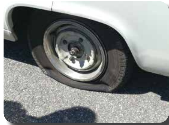
De Prefect met een lekke linker achterband.

Het is altijd een leuke rit, met veel deelnemers en mooie auto's. Volgend jaar, de laatste zaterdag van de maand juni. Misschien zijn we dan niet meer de enige Ford???