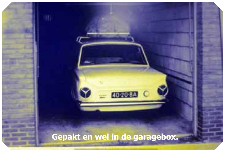
Gepakt en wel in de garagebox.