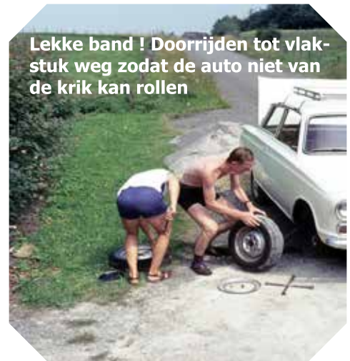
Lekke band ! Doorrijden tot vlakstuk weg zodat de auto niet van de krik kan rollen