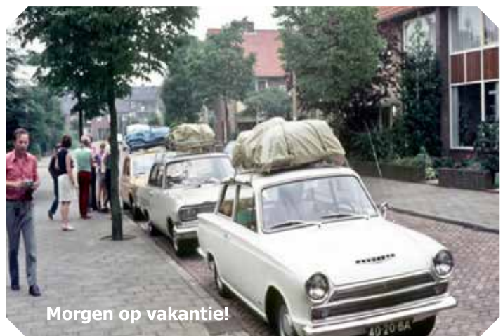
Morgen op vakantie!