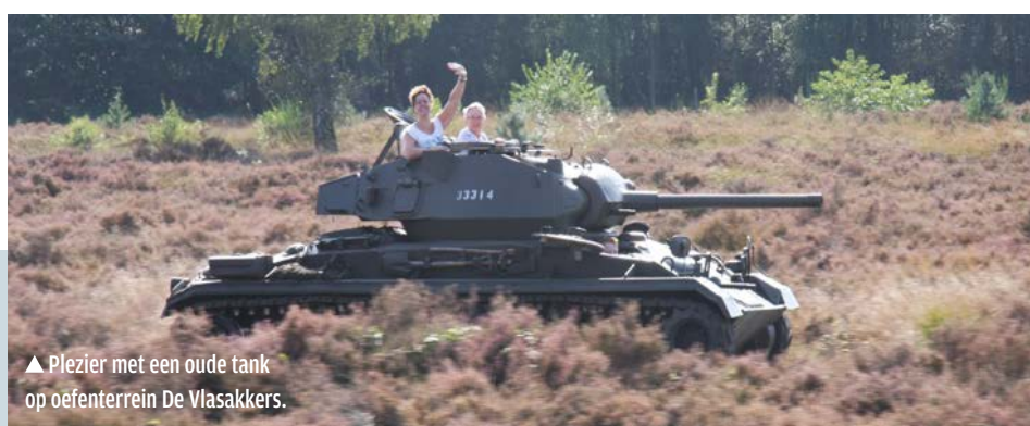
▲ Plezier met een oude tank op oefenterrein De Vlasakkers.

Met een beetje goede wil kun je ook de auto's van het Koninklijk Huis als rijksvoertuigen zien. Ze zijn in ieder geval direct of indirect met ons belastinggeld betaald. Meestal gaat het om speciaal verlengde of verhoogde limousines voor ons staatshoofd. Van alle zo verbouwde limo's is de Austin Sheerline met Pennock-carrosserie mijn persoonlijke favoriet.