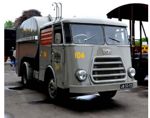
▼ DAF-vuilniswagen in Groningen.