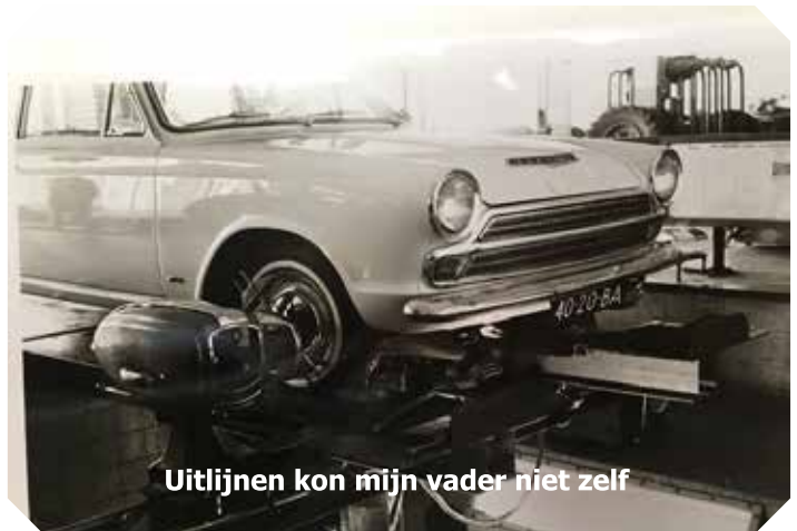
Uitlijnen kon mijn vader niet zelf

Zoals al eerder gememoreerd was mijn vader radiotechnicus. Het is hem gelukt om een compacte bandrecorder van Philips als voorloper van de cassette recorder in de Ford gebouwd te krijgen en daarmee hadden wij dus muziek in de auto.