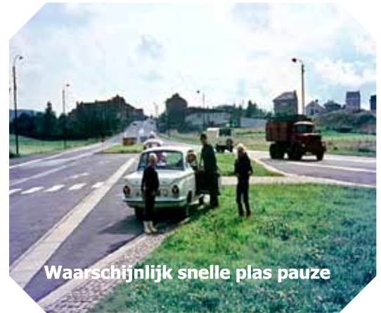
Waarschijnlijk snelle plas pauze