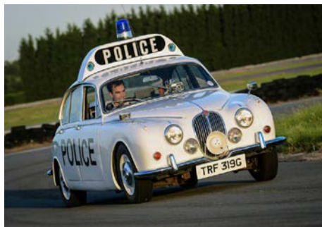
◀ Engelse Jaguar MK II als policecar.

► De Ford AA-brandweerwagen van Ruinerwold staat nu in het Brandweermuseum in Borculo.