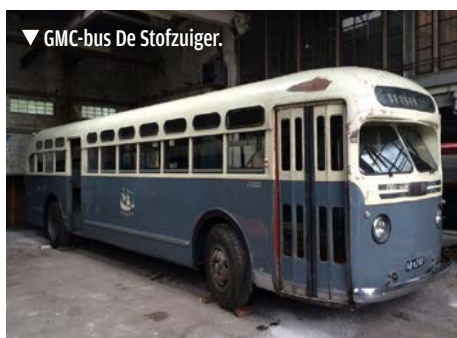
▼ GMC-bus De Stofzuiger.