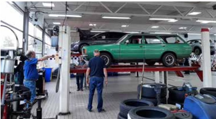
Taurus Station van Marcel Mathijsen

Diverse probleempjes waarvan een deel geen probleempjes waren en/of creatief onder het hoofdstuk vallen van "haastige spoed is zelden (altijd) niet goed".