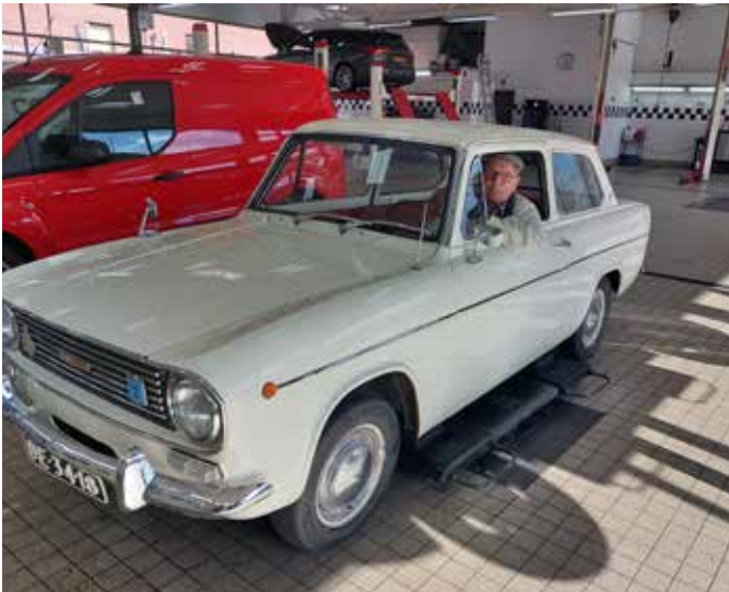
Angla Torino van Willem Rangé