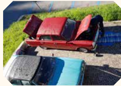
Cortina hotel parkplaats: reparaties en service