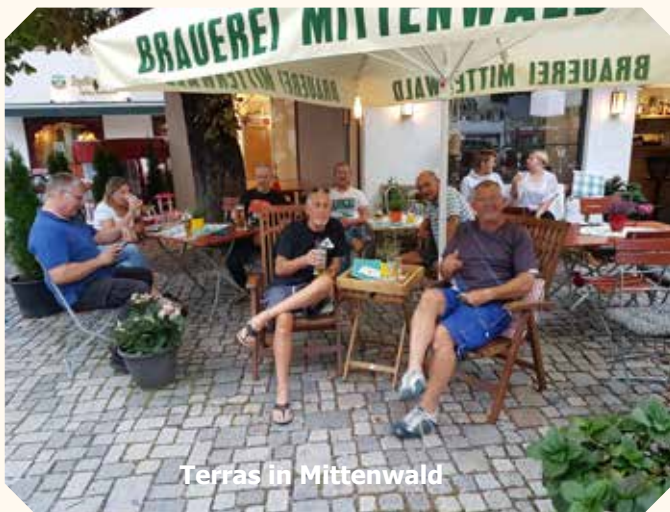
Terras in Mittenwald

Vrijdag in de plenzende regen naar Cortina d'Empezo gereden. Helaas ook de Brennerpas was verregend, dus kap dicht en weinig zien van de omgeving. Onder politie escorte mochten we door het wandelgebied rijden.